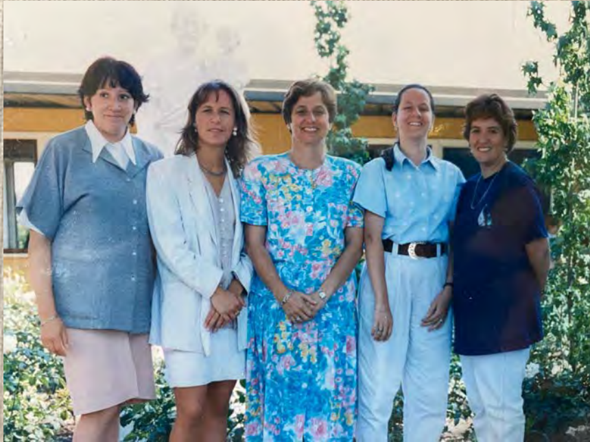
Plana Administrativa 1998

La plana Administrativa 1998, estaba compuesta por: (de izquierda a derecha)