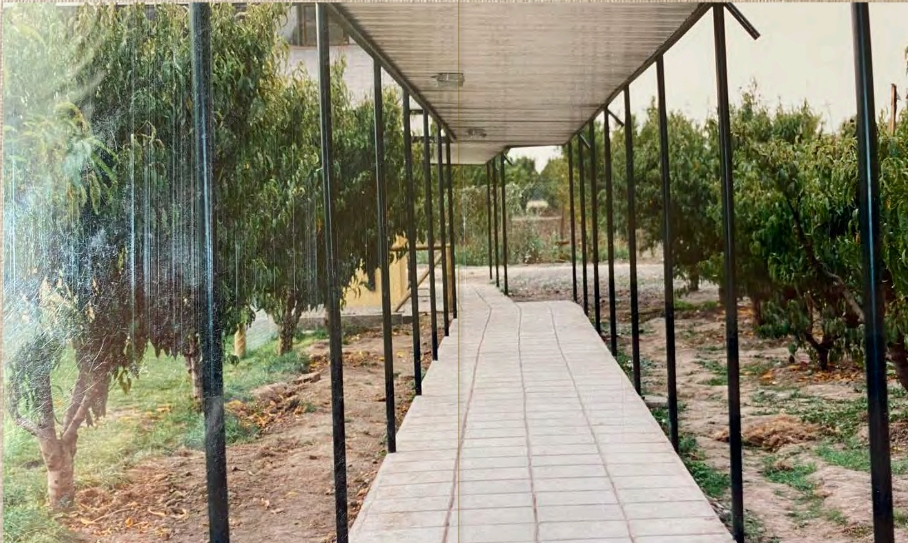
Patio de los naranjos 1998. (Actual pasillo 1° Ciclo)